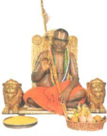
HH 46th Jeer