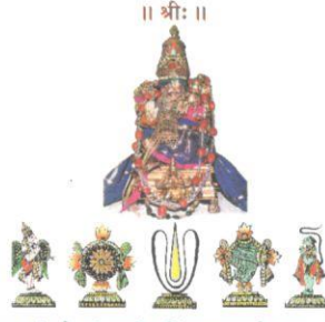
॥ श्रीमते श्रीलक्ष्मीनृसिंह परब्रह्मणे नमः ॥